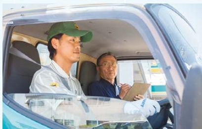
安全指導長による指導