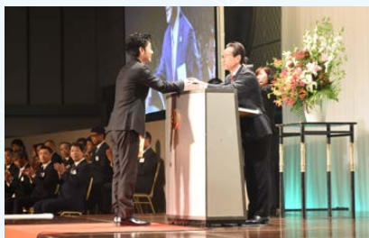
無事故表彰の様子