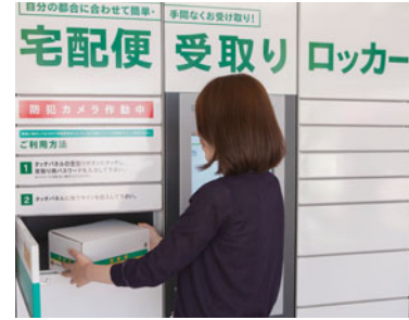
右: ネコサポステー ション前に設置された 宅配ロッカーは、24時 間、365日受け取り可能