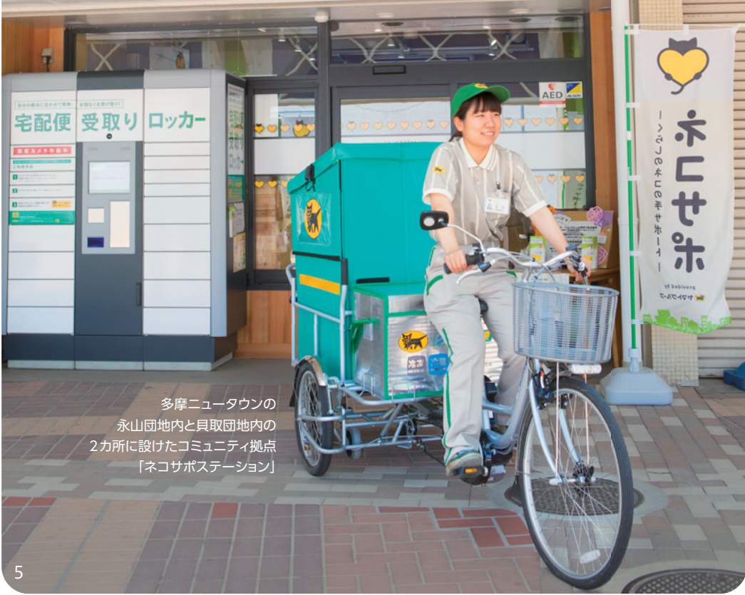
多摩ニュータウンの 永山団地内と貝取団地内の 2カ所に設けたコミュニティ拠点 「ネコサポステーション」

くらしのネコの手サポート — provided by ヤマトグループ ネコサポステーション