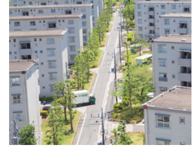
上: 多摩ニュータウン のお客さまに荷物を お届けするヤマト運輸 の車両

団地内に新たに設置したコミュニティ拠点 「ネコサポステーション」を活用して、地域 コミュニティの活性化を図るとともに、他の 宅配事業者の荷物をヤマト運輸がまとめて お届けする一括配送や、自治体、民間企業が 協力して地域住民の生活をサポートする サービスを提供しています。さらに地域に お住まいの方々を採用し、さまざまな業務で 活躍していただくことも計画しています。