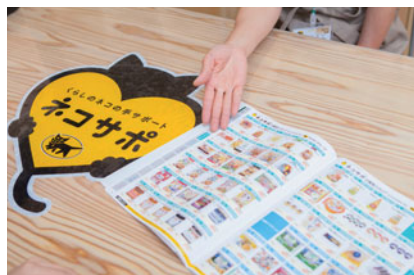
左上・下:「買い物サポート」では、電話やインターネットだけでなく、「ネコサポステーション」でも商品の注文を受け付け 右:小売店でピックアップした商品をヤマト運輸が店舗から集荷し、お客さまの自宅までお届け