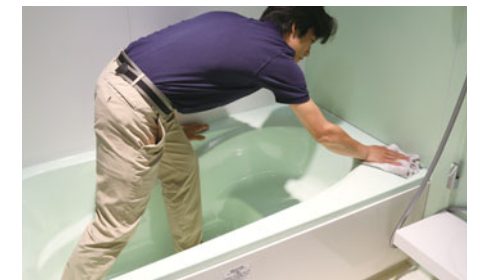
上:団地内での配送ではリアカー付電動自転車も使用 左下:他の宅配事業者の荷物も集約して一括配送 右下:家事サポートサービス