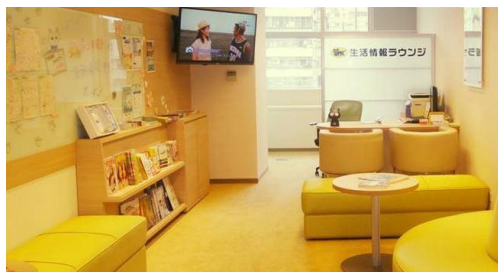
明るく居心地の良い雰囲気台湾の「生活情報ラウンジ」。ここではバザーなどのイベントも開催。

当社は海外引越専門のサービス拠点が日本に18か所あり、経験と知識を兼ね備えた専門スタッフがいます。また、赴任前には、ご赴任される方とご家族を対象とした赴任までに必要な準備、現地での生活情報などをわかりやすくご説明する海外生活セミナーや、企業の担当者様には、企業としての危機管理体制などを外部講師を招いて行うなど企業向けのセミナーを、サービスの一環として、東京だけでなく、各地で定期的開催しています。